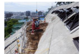
狭い場所での作業