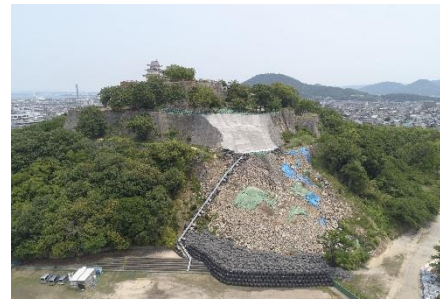
【令和元年6月19日 撮影】

石垣崩落後、本格復旧工事に着手するまでの間、更なる崩落を防ぐため、応急対策工事を行いました。