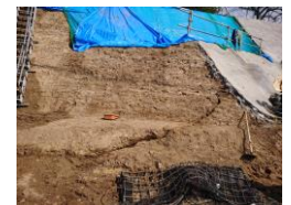
三の丸斜面のクラック