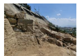
三の丸の埋没石垣